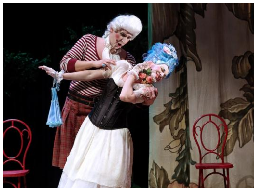
Сцена из оперы Д. Чимарозы «Тайный брак»