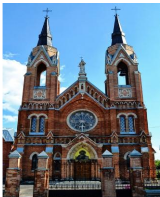
Римско-католический храм Воздвижения Святого Креста

Наш город Тамбов богат старинными красивейшими зданиями, которые являются ценными архитектурными памятниками, некоторые из них используются для проведения различных музыкальных вечеров. Это, в первую очередь, музей-усадьба Асеевых, дом-музей Чичериных, Рахманиновский зал. Не менее интересной культурной площадкой периодически становится римско-католический храм Воздвижения Святого Креста. Концерты в костёле проводятся регулярно: по воскресеньям храм организует вечера духовной музыки, сюда публика приходит, чтобы услышать завораживающие звуки органа. И один из таких воскресных вечеров мне удалось посетить.